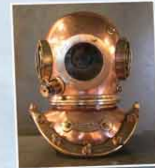
Casque de scaphandrier

The Pointe-au-Père pilot station was operational from 1805 until 1959. To learn about navigation, visit the lighthouse keeper's house.